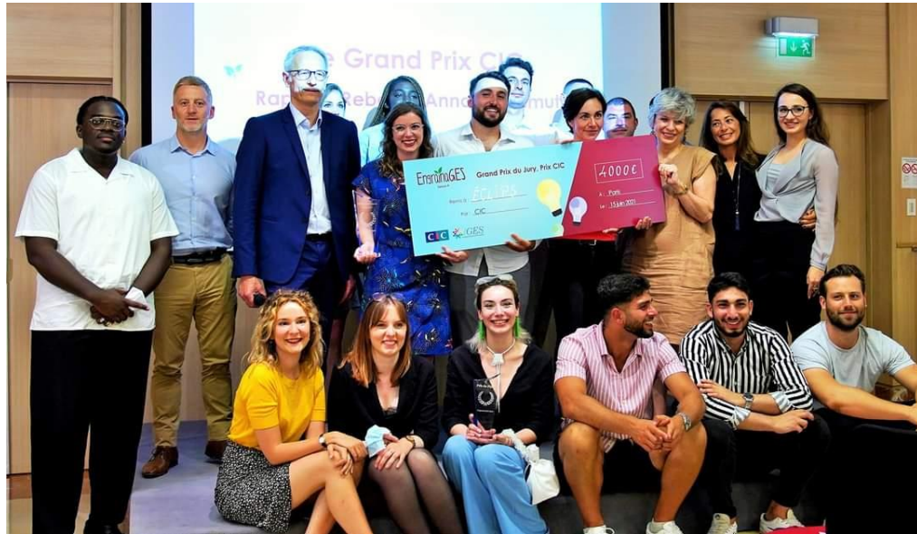
Les finalistes de la Saison 9 – Juin 2021